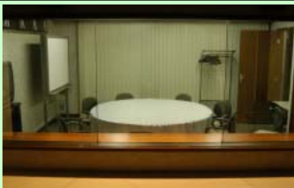
グループインタビュールームは神田の神保町にございます。

製品開発の着手・未着手の意思決定、あるいは、製品コンセプトの開発、等、開発の方向性を探るインタビューテーマには最適です。